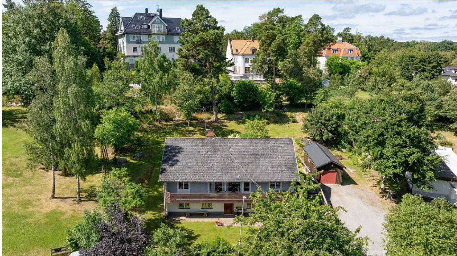
BILDER FRÅN BEFINTLIG TOMT OCH PÅ OMGIVANDE BYGGNADER